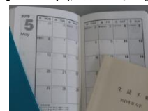
大判となり 書込みがしやすい 生徒手帳

今年度も学校外と積極的に関わり、地域コミュニティ充実の一翼を担っていく。生徒の活躍の場を拡げ、 自己肯定感や自己有用感を持たせる ことで、WIN・WINの関係づくりに学校全体で取り組んでいく。