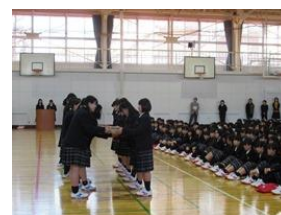
便利グッズ の贈呈

4月9日(火)、新入生と在校生が初めて顔を合わせる、対面式を行いました。校長先生のあいさつの後、生徒会長の歓迎のことば、新入生代表のことばが述べられました。また、1年生各クラスに、教室の整理・整頓用、便利グッズが贈呈されました。