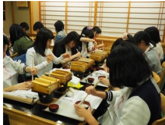
ハッ橋や和菓子作りを体験