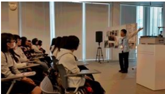
異人館にて→ 震災学習の様子