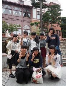
神戸の街を背景に