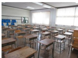
夏休み中も 整理された 校内

本校では、「授業5原則」・「CLEAN THE TABLE」と、学校生活の環境を整える指針を示しています。Q1～Q5のほとんどが 90%を 超える肯定的な意見となっており、生徒の皆さんがしっかり学校生活を送ろうとする姿勢が確認できました。また、「朝読書」に積極的に取り組んでいることで、遅刻をする生徒が少なく、1時間目から集中して授業に臨んでいます。